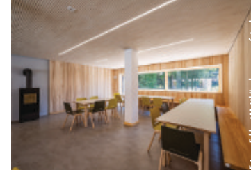
Haus „Alte Mühle“